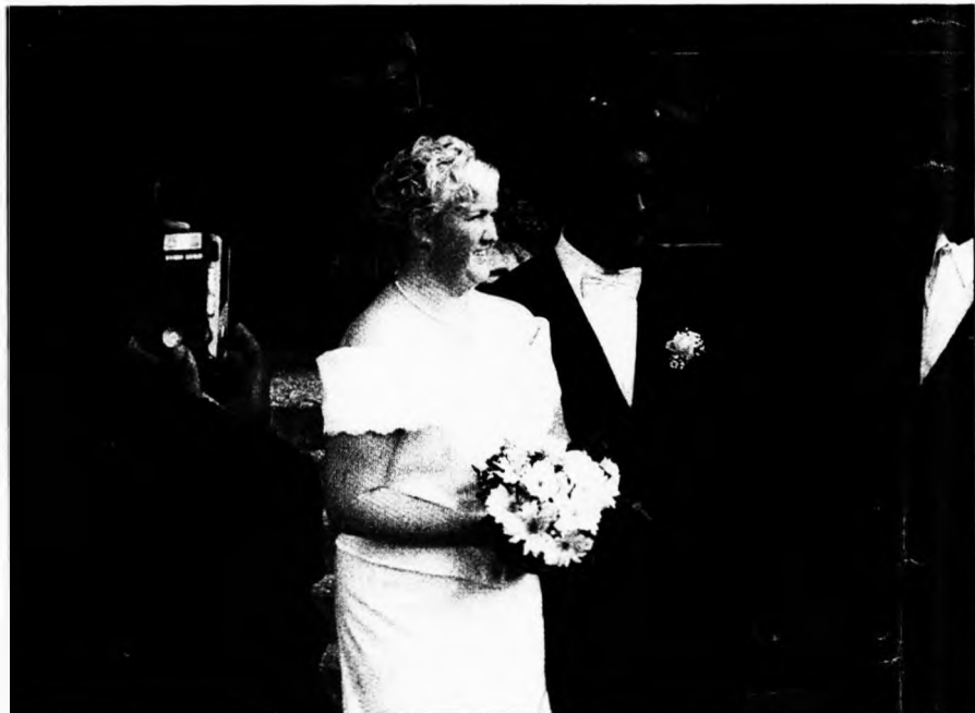
Koppenhágai esküvő. Jönnek az együttélés nehézségei

„Aki Hollandiában lakik, beszéljen hollandul” – követelte Rita Verdonk volt bevándorlási miniszter, aki tavaly tagadni kényszerült, hogy kormánya fontolgatná