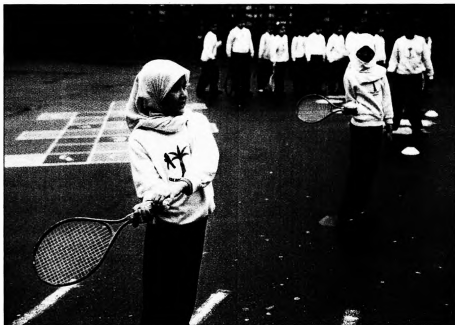
Teniszóra a londoni Islamia Általános Iskolában. Ütéseket adnak, ütéseket kapnak

Az európaiak viszonya az utóbbi években leginkább a muszlim kisebbségi csoportokkal vált feszültté. Ha az ellentétek elmérgesednek, féltő, hogy mindkét oldalon a most még mérsékelt többség is beszáll a háborúságba.