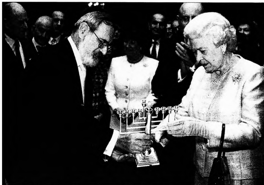
Sacks brit főrabbi II. Erzsébet királynővel. Merre lobbannak lángok?

gyományos életstílust féltő politikusok a vén kontinens számos más országában aratnak sikereket. Olaszországban Romano Prodi miniszterelnök, aki az Európai Bizottság elnökéként mindig is az emberek szabad mozgása és az unió bővítése mellett foglalt állást, miután Romániából több százezer roma érkezett Olaszországba, kormányával rendeletet hozott a