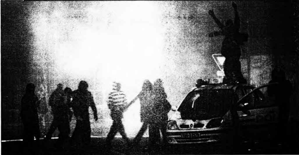
Arab fiatalok összecsapása a rendőrséggel Párizsban. A helyzet magaslatán

„közbiztonságot fenyegető” jövevények hazaszupplálásáról (HVG, 2007. november 17.). Brüsszelben az utóbbi években sokat durvult a kisebbségekről szóló viták hangneme és szóhasználata, aminek alighanem szerepe van abban, hogy a 2008-as esztendő „a kultúrák közötti párbeszéd évének” nyilvánították.